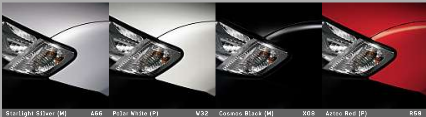
Starlight Silver (M)