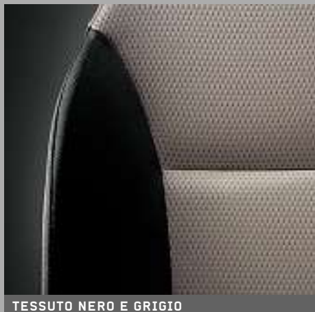
TESSUTO NERO E GRIGIO